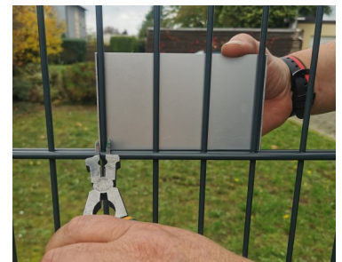
Schild v. d. Rückseite verklemmen

WMT Werbe- und Metalltechnik, Marmelinghöfener Weg 30, 59199 Bönen