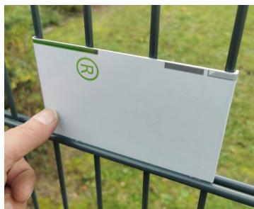
Schild fixieren o. festhalten